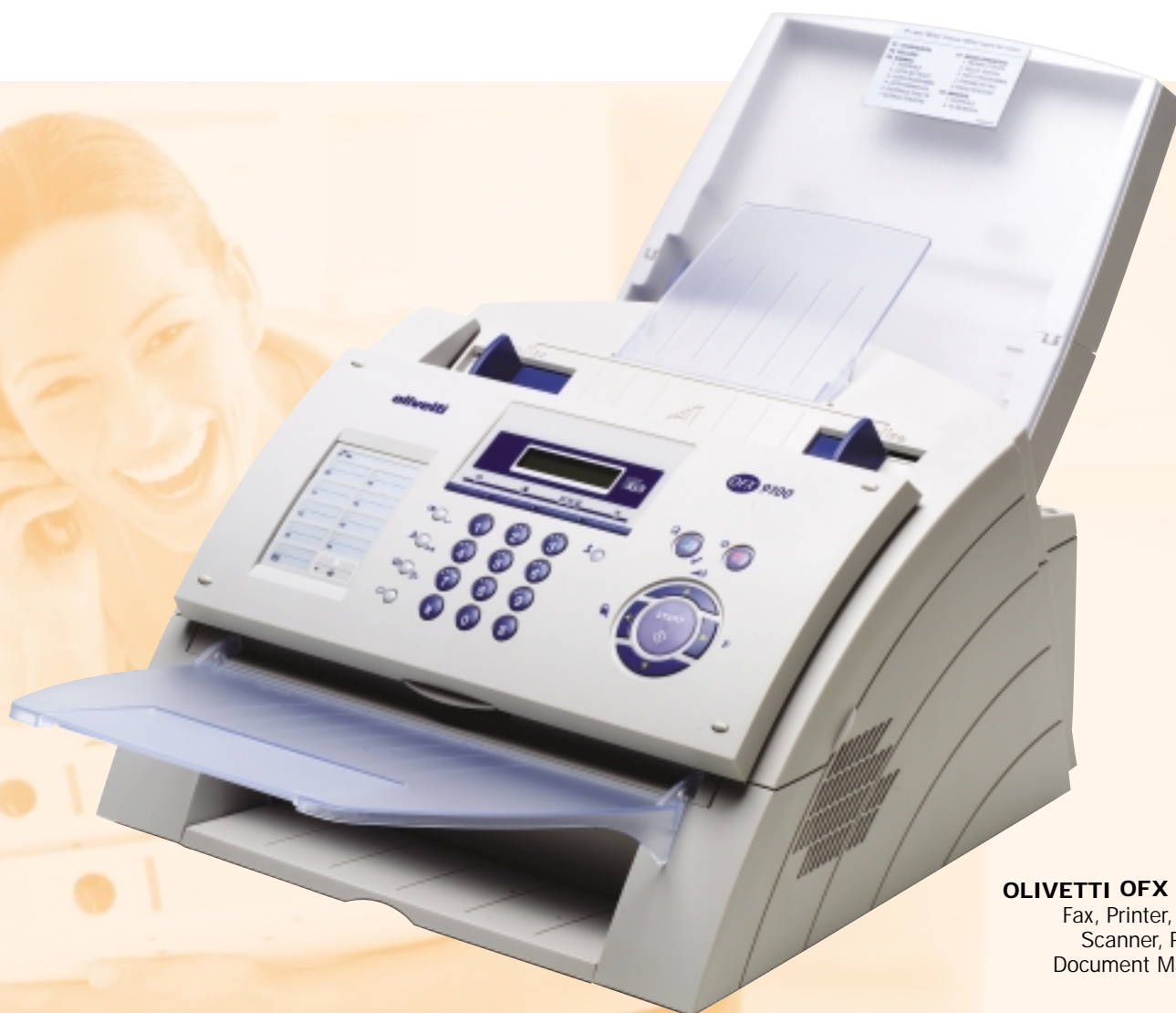
OLIVETTI OFX 9100 Fax, Printer, Copier Scanner, PC Fax, Document Manager