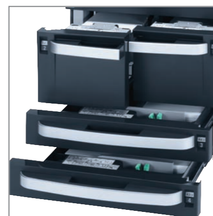
CAPACITÀ CARTA STANDARD fino a 4.100 fogli