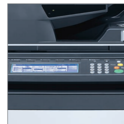
LARGE ÉCRAN TACTILE 8" (résolution 640x240 dpi)