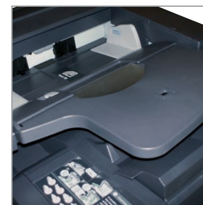
SCAN RECTO VERSO HAUTE VITESSE