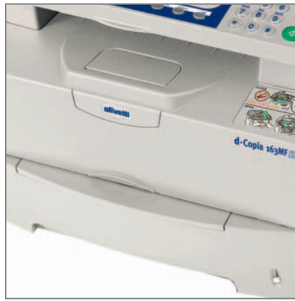
CASSETTO CARTA da 250 fogli e BY-PASS a foglio singolo