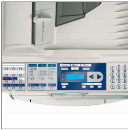
PANNELLO OPERATORE con tasti funzione copia, scansione e fax (d-Copia 164MF)