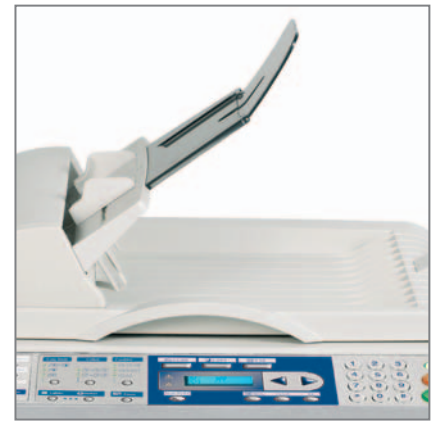
ALIMENTATORE ORIGINALI da 50 fogli di serie