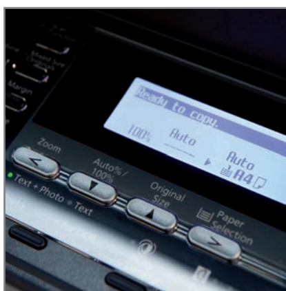
PANNEAU DE CONTRÔLE avec accès rapide aux fonctions