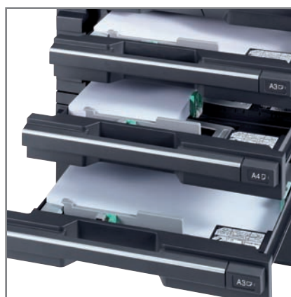
TROIS CASSETTES OPTIONNELLES d'une capacité de 300 feuilles chacun