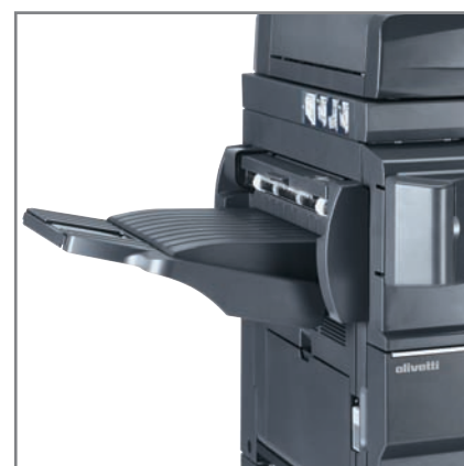
MODULE DE FINITION optionnel