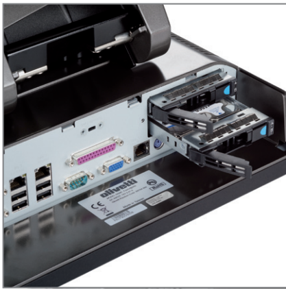
SUPPORTA 2 GIGA LAN, 2 HARD DISK RIMOVIBILI CON FUNZIONE RAID 0,1