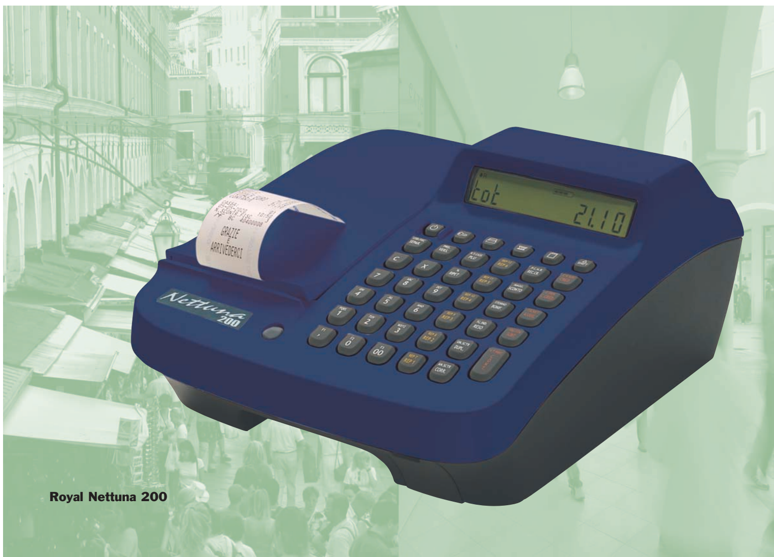
Royal Nettuna 200