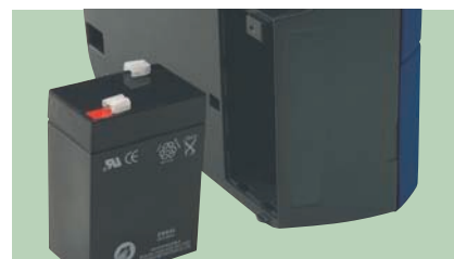
Batteria interna ricaricabile sostituibile dall'utente