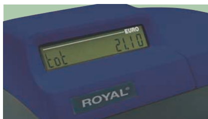
Display cliente retroilluminato