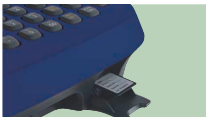
Giornale di fondo elettronico