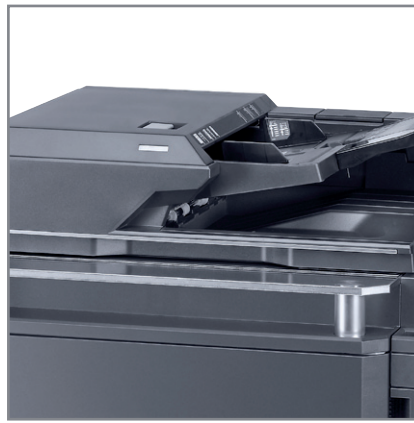
PROCESSORE DEI DOCUMENTI DA 160 ipm E 270 FOGLI DI CAPACITÀ