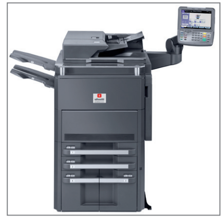
VERSIONE BASE CON PROCESSORE DI DOCUMENTI E 4 CASSETTI