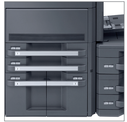
CAPACITÀ CARTA FINO A 7.650 FOGLI (7 CASSETTI + BYPASS)