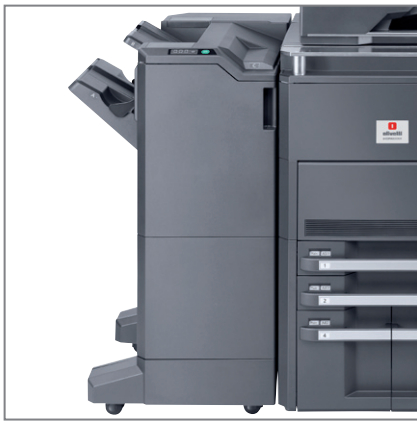
FINITORE DA 4.000 FOGLI E UNITÀ DI PIEGATURA A SELLA E PIEGATURA A3