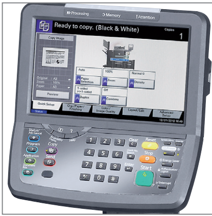
PANNELLO OPERATORE ORIENTABILE, TOUCH PANEL DA 10,1"