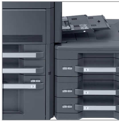
GRAMMATURA CARTA DA 60 A 300 g/m 2